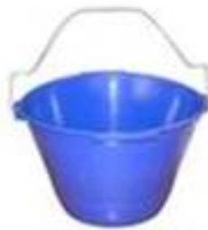
SECCHIO MURATORE MM. 36 ANTINFORTUNISTICO