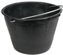
SECCHIO MURATORE NERO MM.34