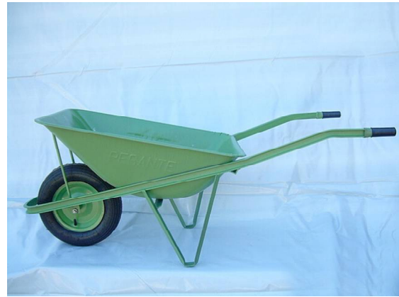
CARRIOLA PESANTE TELAIO FERRO U LAMIERA 9/10 - RUOTA VESPA Cod. 6 ITA 00 020