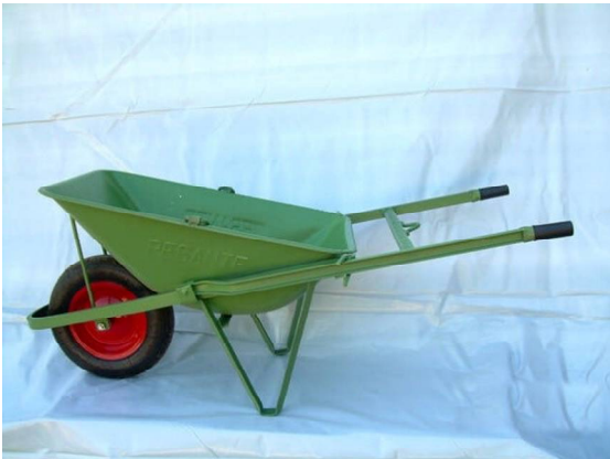
CARRIOLA PESANTE PER TIRO Cod. 6 ITA 00 030