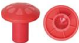
FUNGO COPRITONDINO (Pz.100)

Cod. 6STA FUNGO-01-100 MM 6/18 6STA FUNGO-02-100 " 18/32