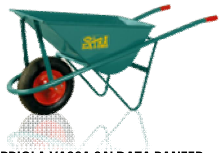
CARRIOLA VASCA SALDATA PANZER 6 ITA 00 040