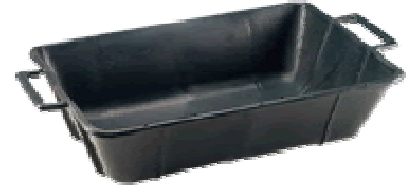
CASSA MALTA RINFORZATA