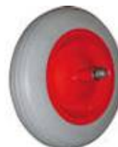
RUOTA CARRIOLA POLIURETANO ASSE LUNGO – ASSE CORTO