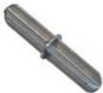
SPINOTTO SEMPLICE Cod. 6 EDI EM125