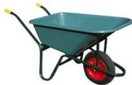
CARRIOLA VASCA PVC 100 LT ruota 380 Cod. 6 ITA 00 045