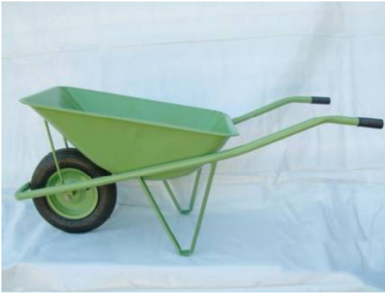
CARRIOLA CLASSICA TELAIO IN TUBO RUOTA VESPA LAMIERA 8/10 Cod. 6 ITA 00 010