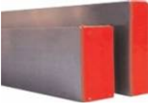
STADIA ALLUMINIO 30X60

Cod. 6BAU A10183666.200 H. 200 CM 6BAU A10183666.250 H. 250 " 6BAU A10183666.300 H. 300 " 6BAU A10183666.350 H. 350 " 6BAU A10183666.400 H. 400 "