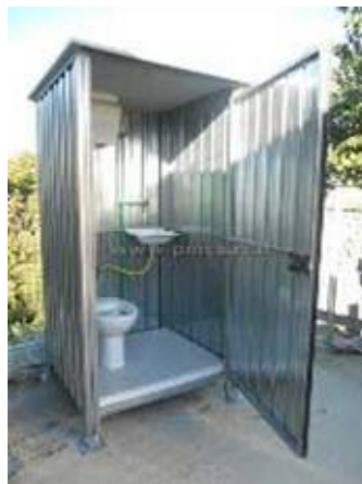
BAGNO DA CANTIERE