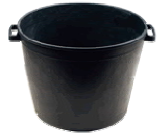
CASSA MACERIE TONDA