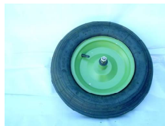
RUOTA VESPA Cod. 6 ITA 00 150 CM 17 6 ITA 00 152 CM 21