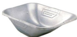
CASSONE CARRIOLA ZINCATO 8/10 Cod. 6 ITA 00 160