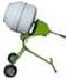
BETONIERA LT 100 KW 0 Cod. 6 EDI EM199