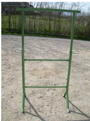
CAVALLETTO DOPPIO Cod. 6 ITA 00 050