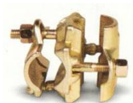
GIUNTO ORTOGONALE Cod. 6 EDI EM123