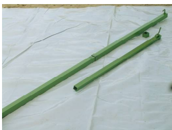
CALANDRO TELESCOPICO SFILABILE Cod. 6 ITA 00 080 2.25/3.30 verniciato 6 ITA 00 090 2.50/4.20 verniciato 6 ITA 00 095 2.50/3.30 zincato