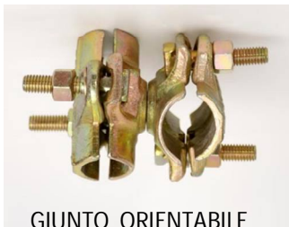
GIUNTO ORIENTABILE Cod. 6 EDI EM124