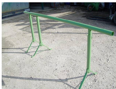
CAVALLETTO TRIPLO ESTENSIBILE Cod. 6 ITA 00 060